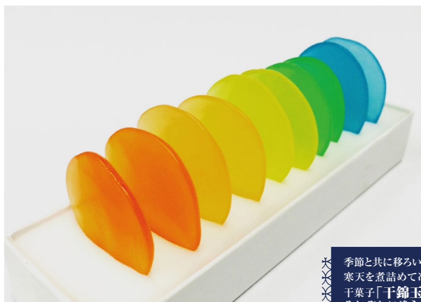
2,000円(税込)(完全予約制で店頭受け取りのみ)

ネオ和菓子とは伝統的な和菓子に洋菓子の要素を組み込み作られた進化系和菓子の事を指します。 見た目が新鮮なものや華やかな物が多く、SNSを通じて若者を中心に拡散され現在人気は拡大しています。 洋菓子に比べて比較的若者とは縁が遠かった和菓子ですが、進化系和菓子を機に現在は若者の間でも差し入れやギフトとして使用される機会が増えてきています。